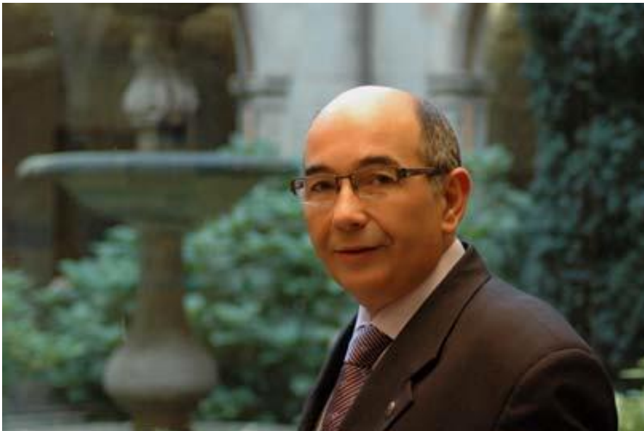
Francisco Ramón Durán Vila