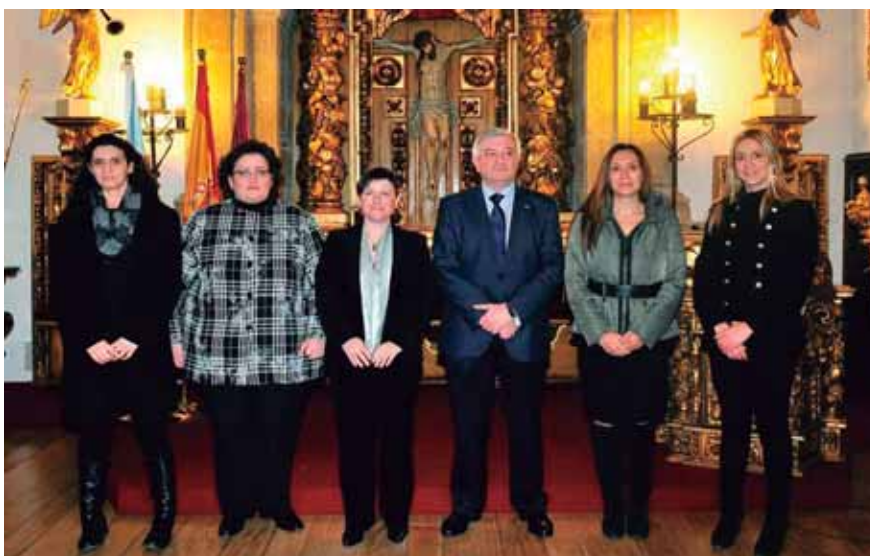
Acto de toma de posesión. Equipo decanal de la Facultad de CC. de la Educación

En este momento está muy deteriorado. El enfoque de gobierno del SUG de los últimos años (ya no hablo sólo de financiación y falta de autonomía) ha provocado un desencuentro constante entre las tres universidades a las que se somete a una competitividad nada constructiva a cambio de conseguir menos financiación. La reducción de ingresos, sumada a una política de escasa visión y aprecio por las universidades públicas, está conduciendo a un desencuentro y una desconfianza constante. Las universidades del SUG se encuentran actualmente en una encrucijada muy compleja en la que el crecimiento o los éxitos de una implican el deterioro o demérito de la otra en lugar de promover su complementariedad y excelencia. Esto no es admisible y conduce al deterioro del SUG.