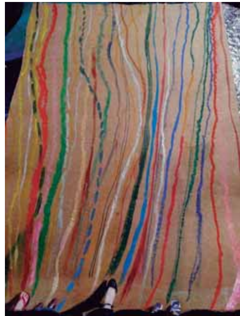
Imagen 1. Ilustración del Proyecto-Taller para 2º de la ESO titulada "Mis caminos de colores, pese a las penas"